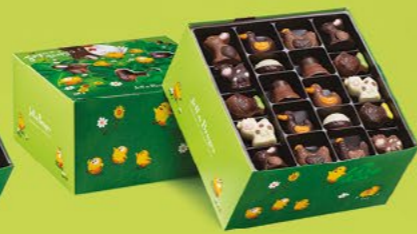
LE BALLOTIN DE 750 G NET 60 CHOCOLATS ASSORTIS