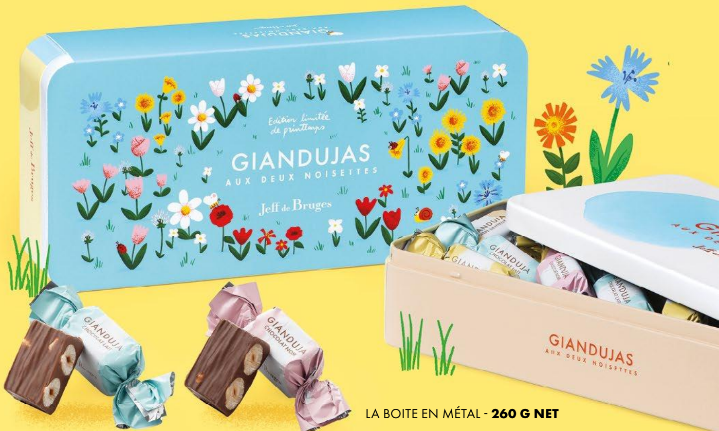
Chocolat au lait

Imaginez notre fameux gianduja dans lequel sont plongées non pas une mais deux noisettes entières. Voici l'alliance exquise du croquant et du fondant !