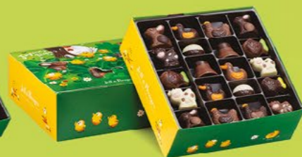
LE BALLOTIN DE 500 G NET 40 CHOCOLATS ASSORTIS